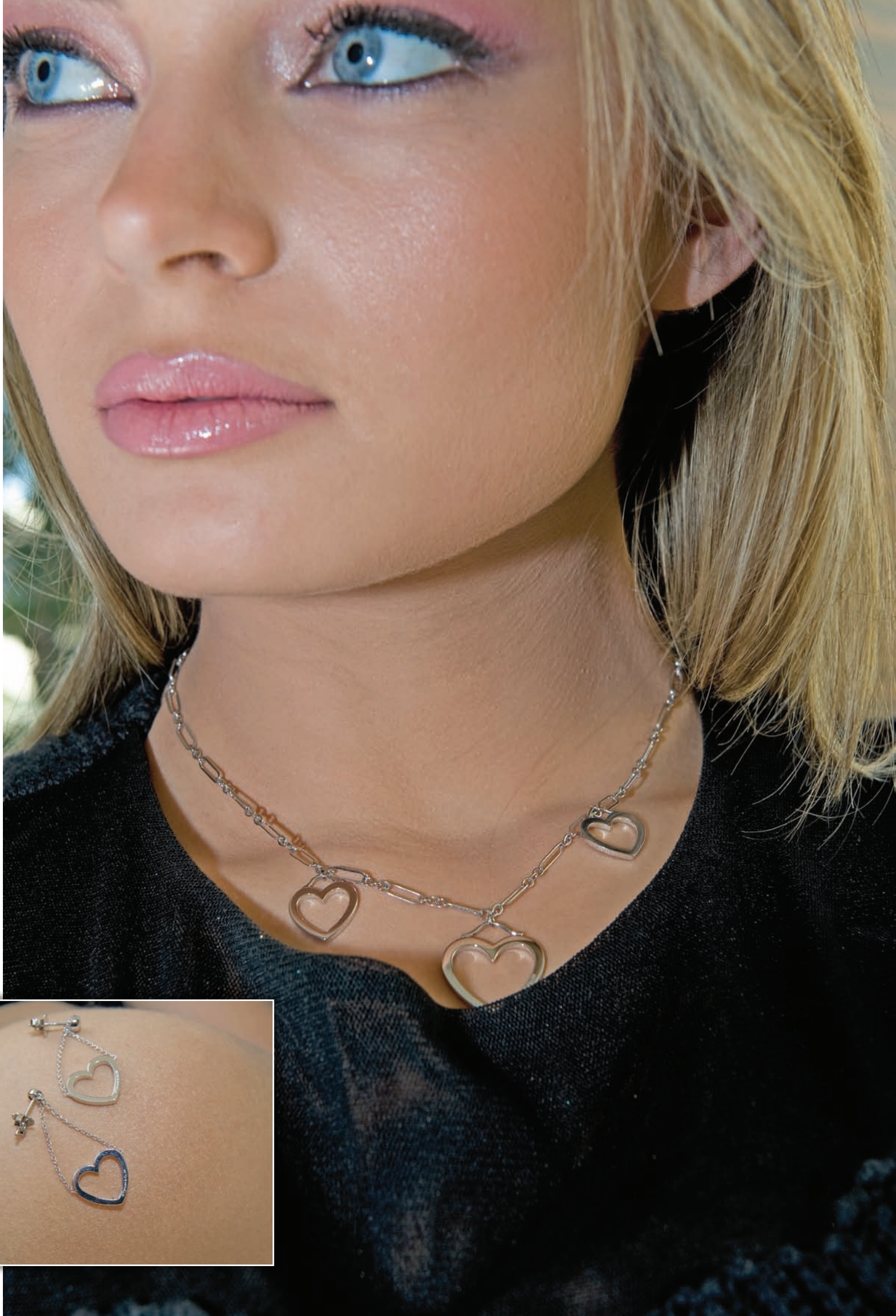
Collier et boucles d'oreilles collection "multi Hearts" : "Tiffany" en or blanc. En vente chez Antoine Hakim