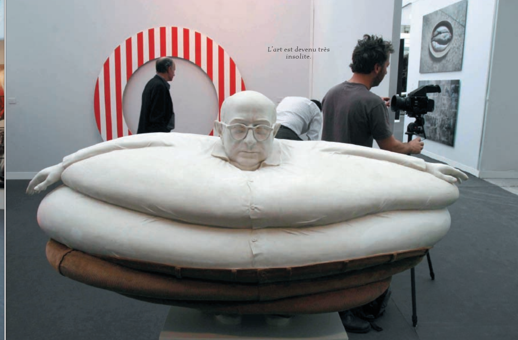
L'art est devenu très insolite.