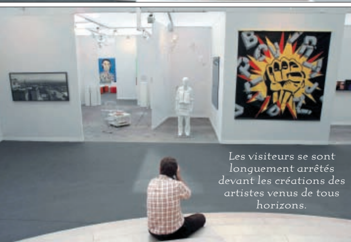
Les visiteurs se sont longuement arrêtés devant les créations des artistes venus de tous horizons.