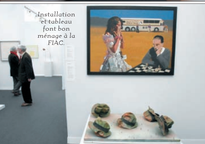
Installation et tableau font bon ménage à la FIAC.